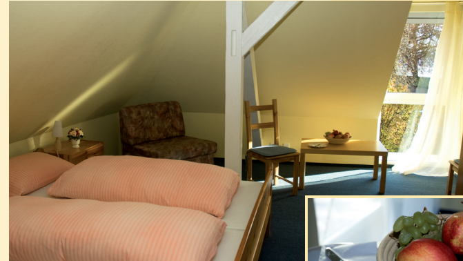
DZ / DG