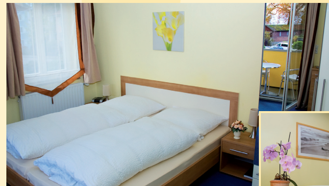
DZ / Balkon