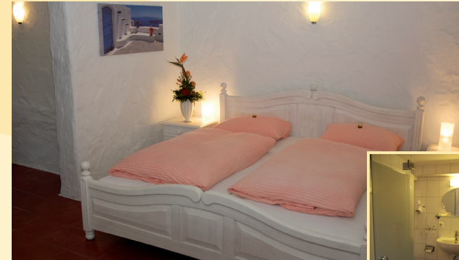
DZ / Terrasse