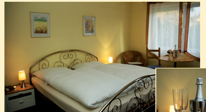
DZ / Balkon