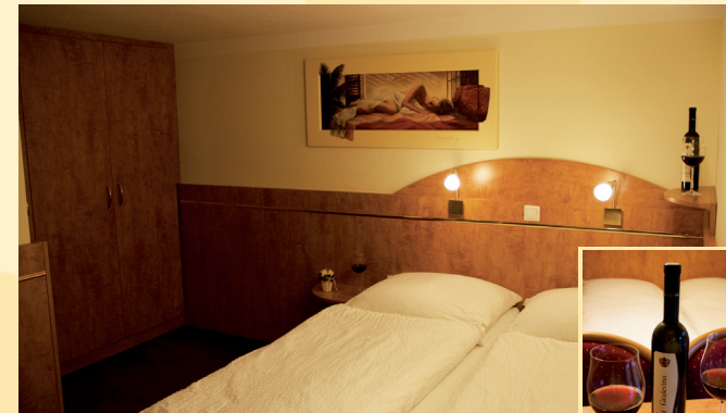
FZ / Terrasse